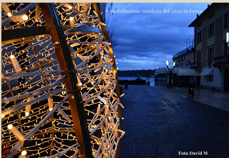
Installazione natalizia del 2020 in Fossa